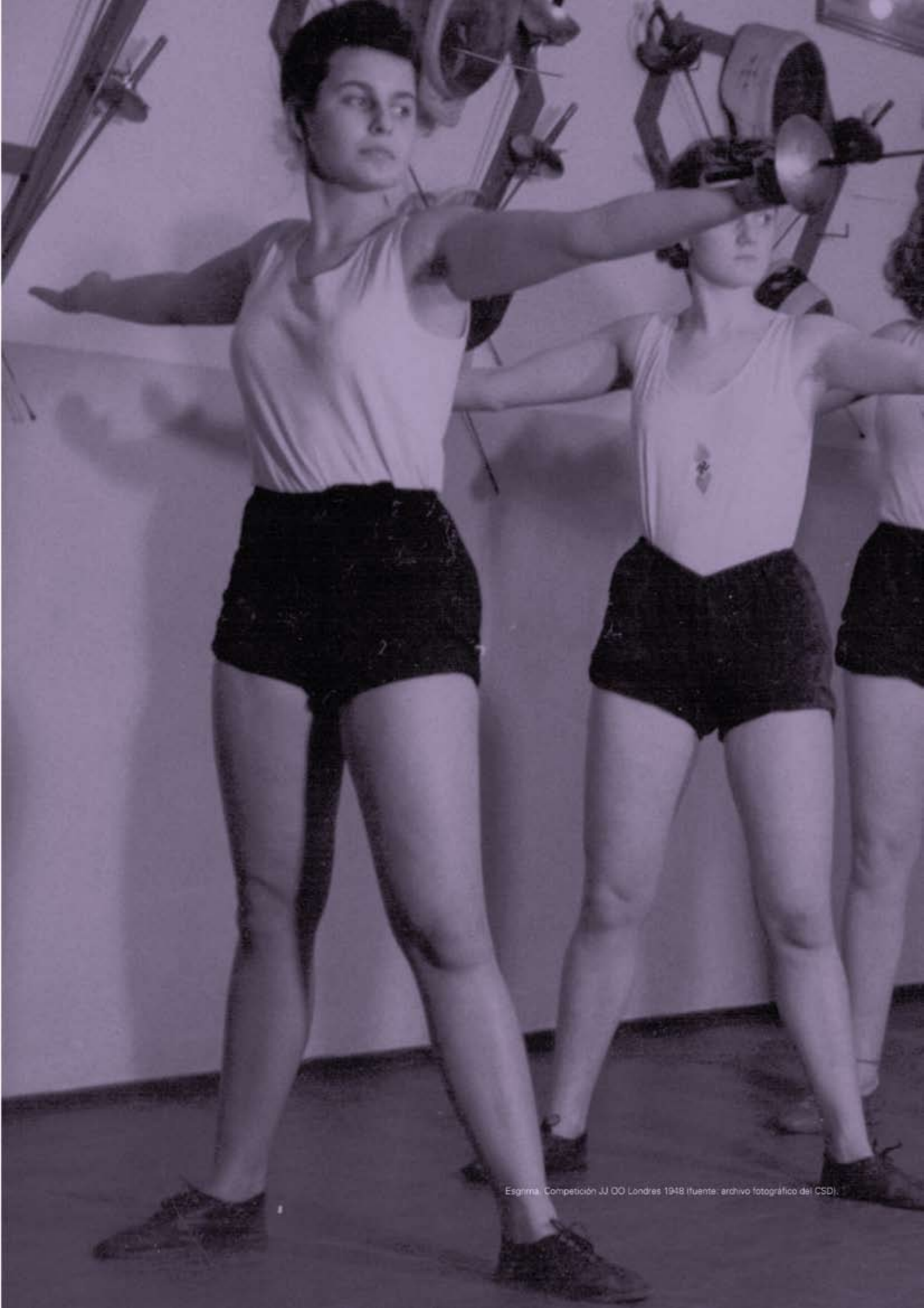
Esgrima. Competición JJ OO Londres 1948.

“TODAS LAS COSAS SON IMPOSIBLES MIENTRAS LO PARECEN”