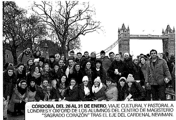
CÓRDOBA, DEL 26 AL 31 DE ENERO, VIAJE CULTURAL Y PASTORAL A LONDRES Y OXFORD DE LOS ALUMNOS DEL CENTRO DE MAGISTERIO "SAGRADO CORAZÓN" TRAS EL EJE DEL CARDENAL NEWMAN.