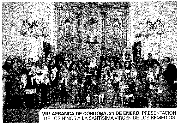
VILLAFRANCA DE CÓRDOBA, 31 DE ENERO, PRESENTACION DE LOS NIÑOS A LA SANTISIMA VIRGEN DE LOS REMEDIOS.