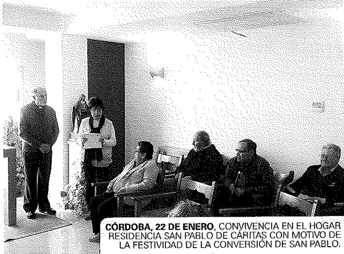
CÓRDOBA, 22 DE ENERO, CONVIVENCIA EN EL HOGAR RESIDENCIA SAN PABLO DE CARITAS CON MOTIVO DE LA FESTIVIDAD DE LA CONVERSION DE SAN PABLO.