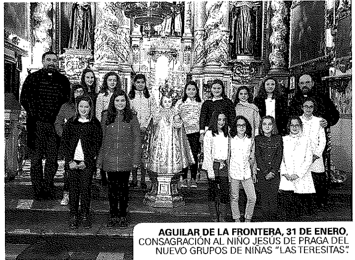
AGUILAR DE LA FRONTERA, 31 DE ENERO, CONSAGRACION AL NIÑO JESUS DE PRAGA DEL NUEVO GRUPOS DE NIÑAS "LAS TERESITAS"