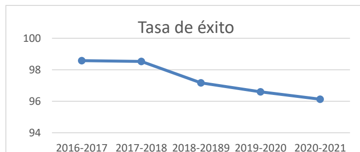
Figura 3. Sostenibilidad del título referida a la tasa de éxito.