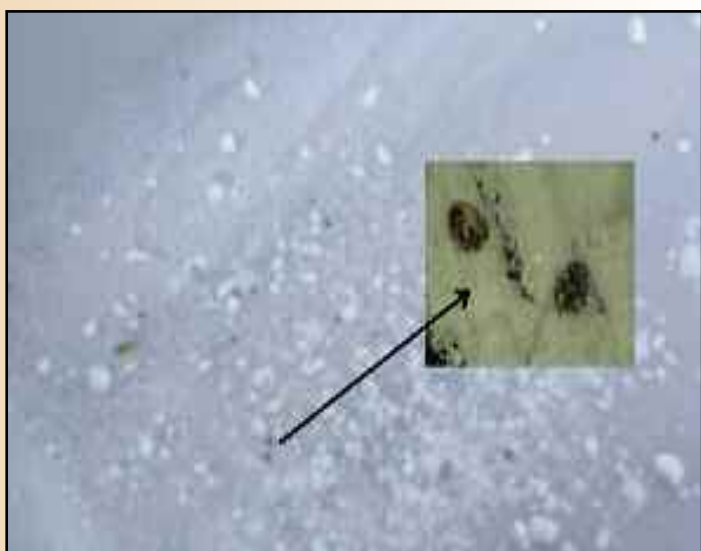
2.5.- Comprobaremos cómo los parásitos caen junto con el azúcar en la bandeja.