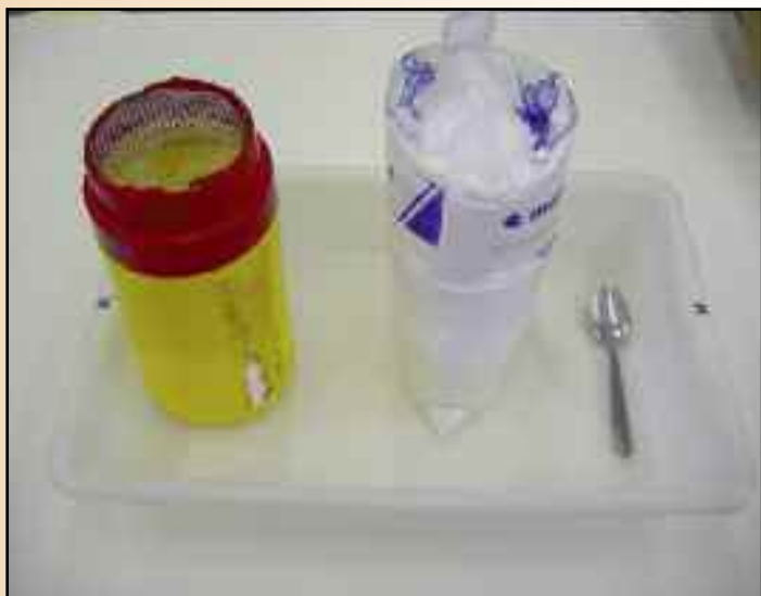
2.1.- Para realizar el diagnóstico necesitaremos un bote con la tapa recortada y una rejilla, una bandeja y azúcar en polvo.

Serie de fotografías 2.- En esta serie de imágenes mostramos los pasos que hay que seguir en el proceso de diagnóstico de la varroosis con azúcar en polvo.