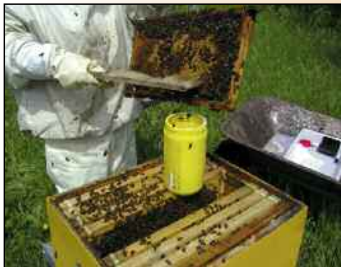
2.2.- Barremos una muestra de abejas, preferiblemente de la zona central de cría.