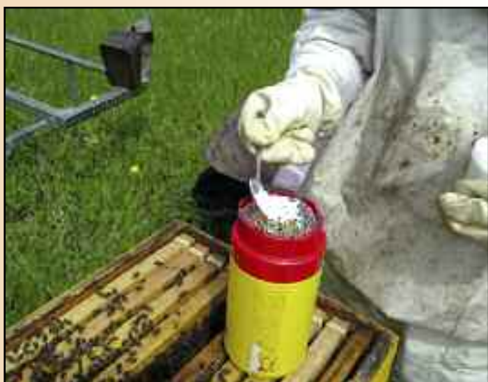
2.3.- Tapamos el bote y añadimos una cucharada sopera de azúcar en polvo.