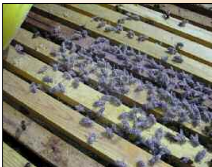
2.6.- Finalizado el diagnóstico, devolvemos las abejas a su colmena.