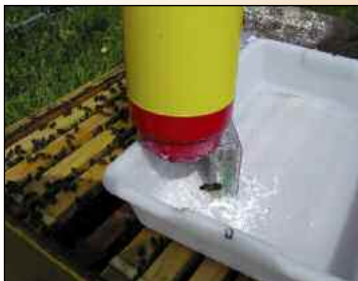
2.4.- Agitamos el bote y lo disponemos hacia abajo sobre la bandeja durante 5 ó 10 minutos.